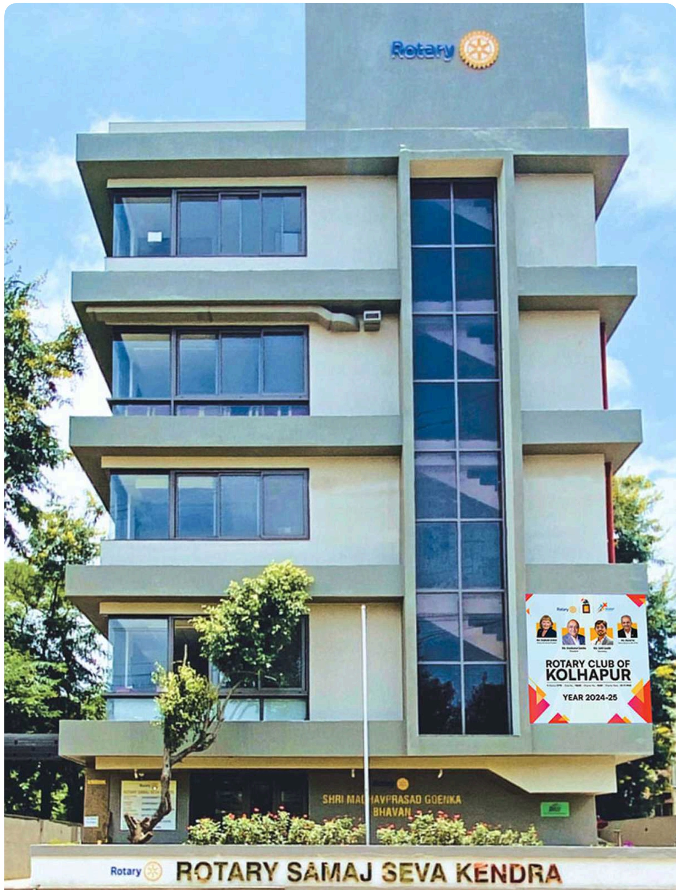
ROTARY CLUB OF KOLHAPUR'S ROTARY SAMAJ SEVA KENDRA BUILDING